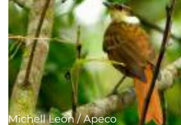
Michell León / Apeco