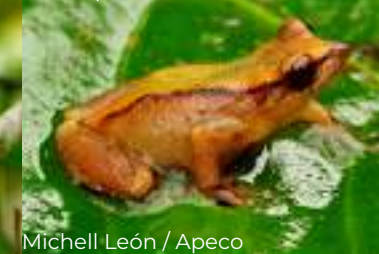
Michell León / Apeco

Especies registradas en inventario biológico.