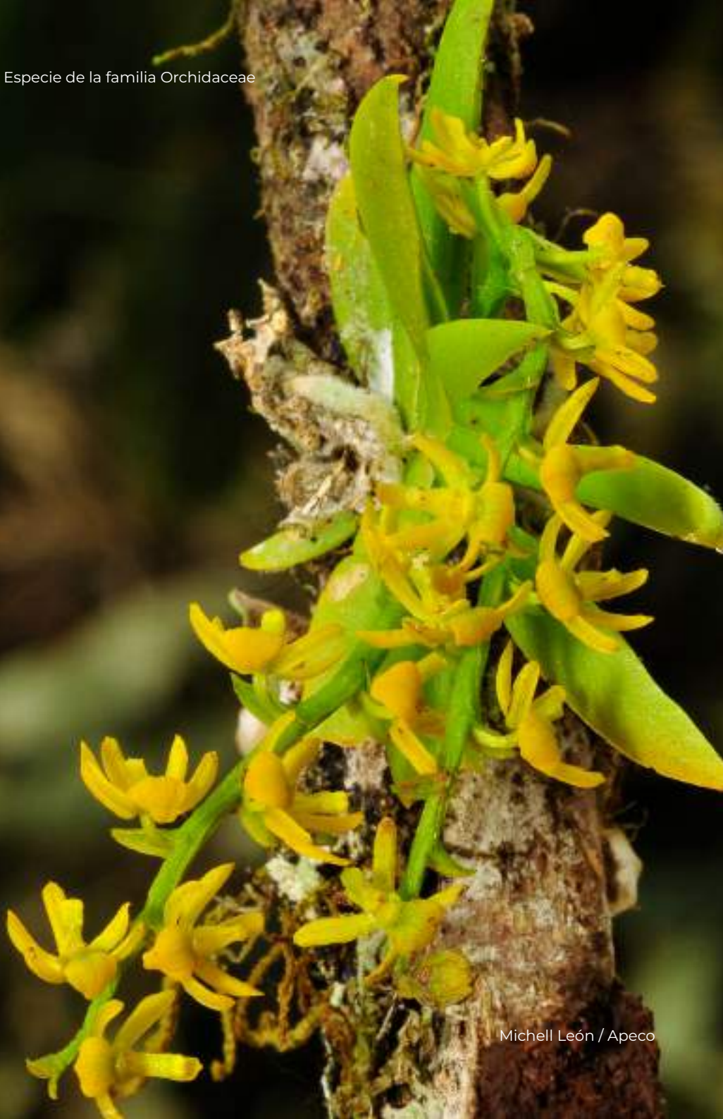
Michell León / Apeco