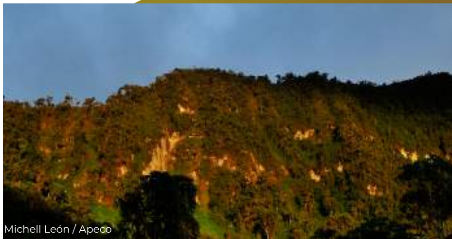
Vista de montaña del ACP Copallín.

Esto es lo que podemos decir en honor a la verdad sobre la Hacienda de Alenya, basándonos en los documentos originales y testimonios de personas mayores, recopilados para esta memoria descriptiva de la Comunidad Campesina de Copallín.