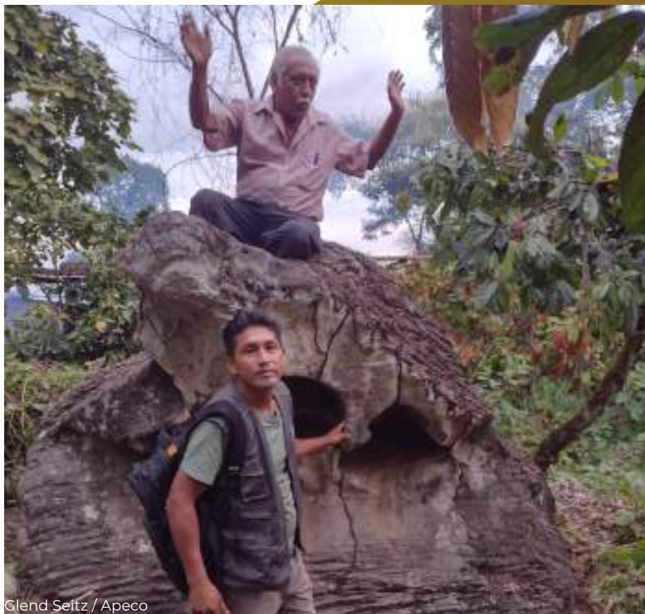
Piedra de Cocodrilo en Lluhuana.

Decidieron nombrarla como la “Cueva las Virtudes” en honor al sacrificio realizado para descubrirla, con la intención de informar al Instituto Nacional de Cultura (INC) y al Estado, para solicitar su apoyo para su inclusión como patrimonio nacional. Sin más que acordar, se dio por finalizada el acta a la 01:30 p. m. del mismo día y año, siendo leída y firmada en conformidad por los presentes.