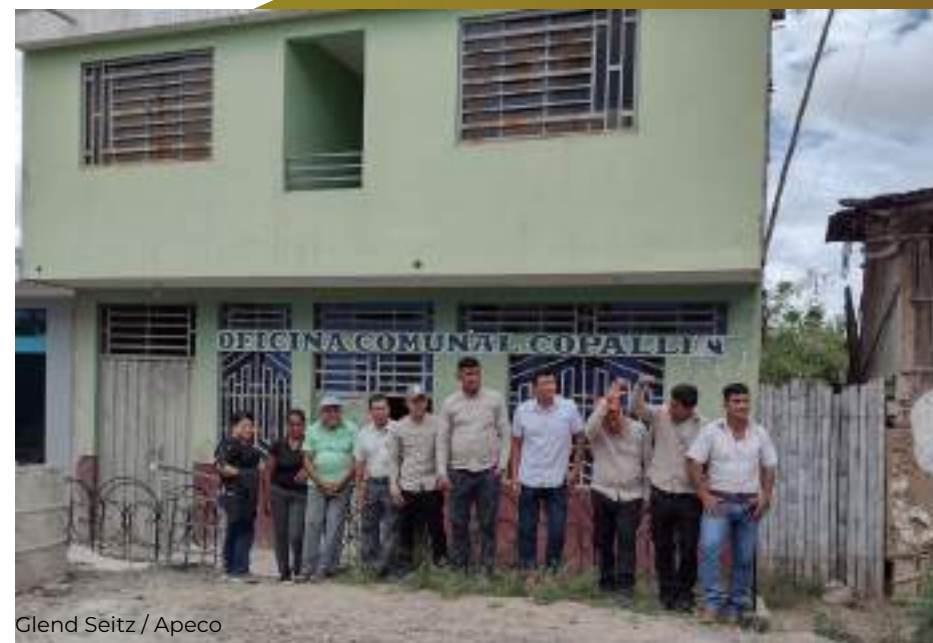
Glend Seitz / Apeco