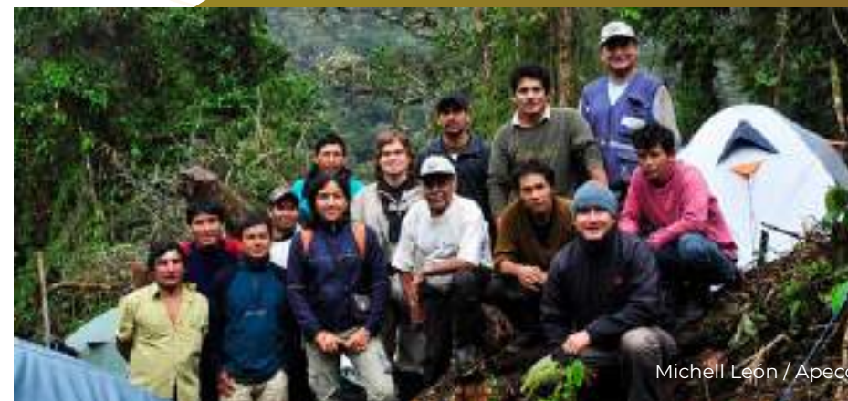
Michell León / Apeco

Equipo que realizó trabajos en campo para inventario biológico del ACP Copallín.