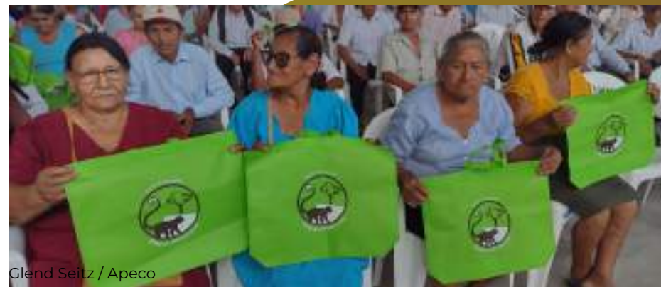
Aniversario del ACP Copallín 2022.

También, se cuenta con diferentes comités en todos los anexos de Copallín, como los comités de autodefensa en los anexos más poblados; y comités de productores agropecuarios, tanto en el distrito como en algunos anexos.