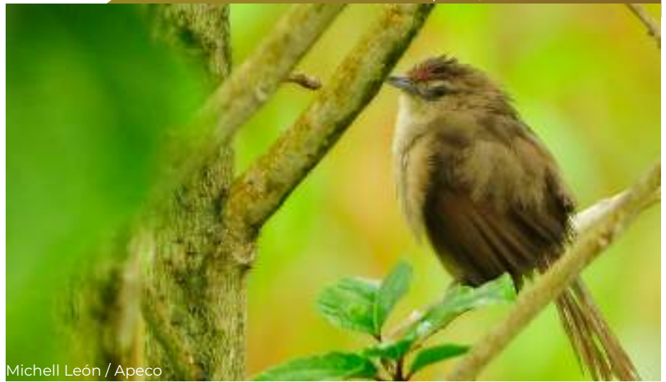
Michell León / Apeco