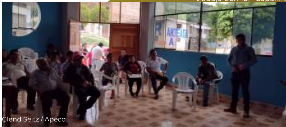
Glend Seitz / Apeco