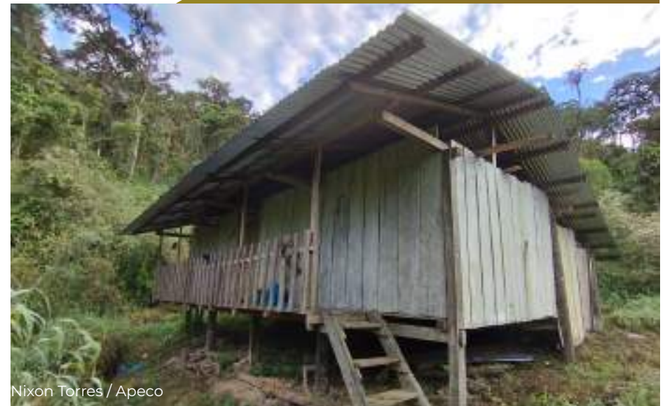
Nixon Torres / Apeco