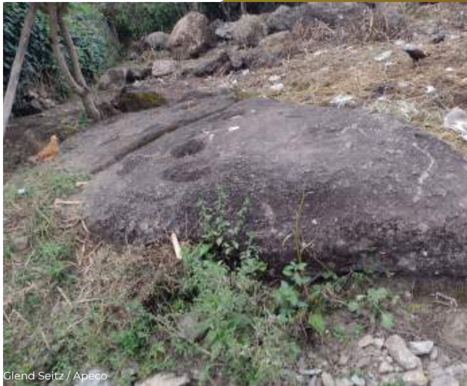
Piedra de Doce Huecos.

Este es uno de los parajes más hermosos en el anexo La Palma, próximas a las bellas cuevas denominadas Cuevas de La Palma. Se encuentra ubicado a 2 horas a pie desde el pueblo de Copallín.