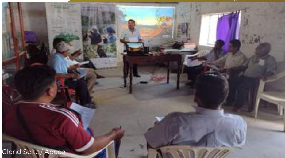
Comisión de Usuarios de la Quebrada Copallín, tomada en agosto de 2023.

Comité de Usuarios Quebrada Copallín: representado por los delegados de los canales Palma Florida, Palma Chonza, Santa Magdalena, La Unión, Nuevo Retiro, Miraflores y Palacios.