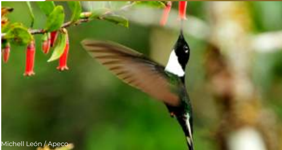
Michell León / Apeco

Inca acorallado ( Coeligena torquata ), especie de ave registrada en el inventario biológico realizado en el 2009.